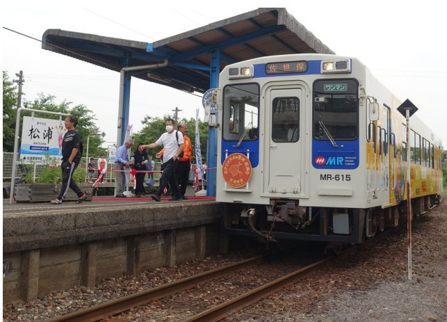
松浦鉄道 「アジフライの聖地松浦号」

アジフライにはソース、醤油、タルタルソース等を合わせることで味変できる。何派が多いのだろう。