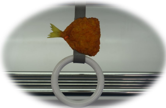
車内つり革 食品サンプルのアジフライがついている

松浦鉄道は元国鉄松浦線が第三セクターとなったもので、未だいくつかの駅舎などに国鉄の雰囲気が残っている。西日本鉄道は西鉄、三陸鉄道は三鉄と呼ばれているが、松浦鉄道はMRと呼ばれる。一般的に経営が厳しい第三セクターの鉄道はいろいろな取り組みを行っている。松浦鉄道では車両の命名権を販売している。その一つに「アジフライの聖地松浦号」がある。ヘッドマークを掲出したラッピング車両である。その車両に乗り合わせたら、つり革を手にしよとしてあっと驚かさせることになる。なんと食品サンプルのアジフライがぶら下がっている。思わずパブロフの犬状態となりアジフライが脳髓に刷り込まれ、アジフライを食べたくなる仕掛けである。